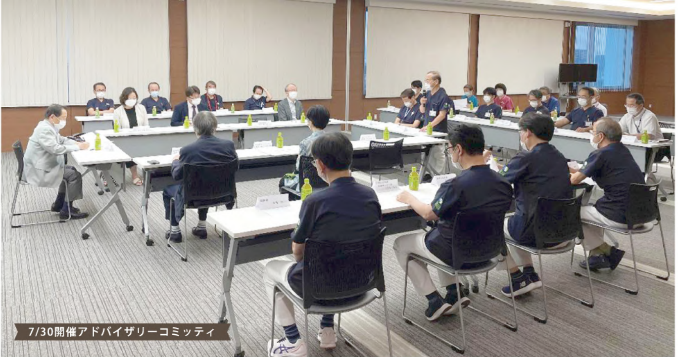
7/30開催アドバイザーコミッティ