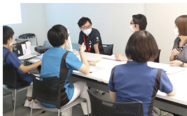
カンファレンスの様子