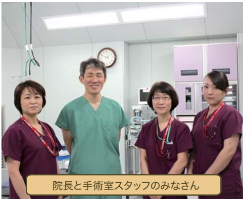
院長と手術室スタッフのみなさん